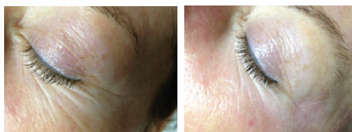
Na 1 behandeling